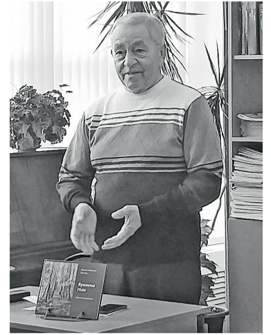
Всех известил – пришёл Покров! И эхом растворился в небе.