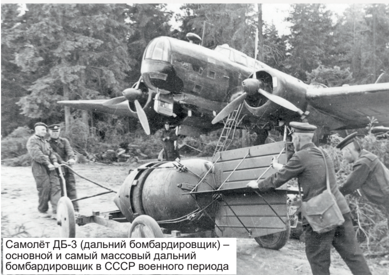
Самолёт ДБ-3 (дальний бомбардировщик) – основной и самый массовый дальний бомбардировщик в СССР военного периода