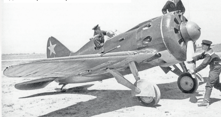
И-16 («Ишачок») – советский одномоторный истребитель-моноплан

5 000 тонн. Морские лётчики числят за собой 14 потопленных финских транспортов и барж. В это же самое время эсминцы 3-го дивизиона провели разведку огневых точек противника у д. Муурилы. Действия отряда командование оценило на отлично. Неудачным оказался выход в море 14 декабря линкора «Октябрьская революция». Линкор и сопровождающие его корабли были готовы к началу операции, но обстрел был отменён из-за плохих метеоусловий. В тот же день на острове Лильхару действиями эсминцев «Грозный» (командир – капитан 3-го ранга К. К. Черемхин, воен-