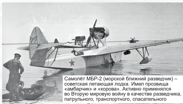
Самолёт МБР-2 (морской ближний разведчик) – советская летающая лодка. Имел прозвища «амбарчик» и «корова». Активно применялся во Вторую мировую войну в качестве разведчика, патрульного, транспортного, спасательного

декабря в 1.00 по московскому времени, а первый боевой вылет самолётов 8-й и 61-й авиационных бригад и авиационной группы особого назначения для выполнения боевого задания над территорией противника, т. е. для прикрытия советских десантов на финляндские острова, начался в 9.50 утра. Боевой приказ № 001 сообщал о начале Финляндией военных действий против СССР, информировал личный состав о десантных операциях Отряда особого назначения флота на острова в Финском заливе и ставил авиационным частям боевые задачи. Так, 1-му МТАП предписывалось найти и уничтожить батареи береговой обороны противника, в частности, батарею на острове Руссаре. Затем ставилась задача прикрыть главную базу флота и Ленинград, а также обеспечить воздушное прикрытие аэродромов 1-го авиаполка, пункта базирования в Лужской губе, где развёртывались силы Отряда особого назначения, аэродромов Котлы и Копорье. 10-я АБ должна была продолжить поиск боевых кораблей и транспортов противника в северной части Балтийского моря, в устье Финского залива и в районе Аландских островов. 15-й АП должен был не позже 16.00 1 декабря 1939 года нанести удар по порту Ловиза и уничтожить