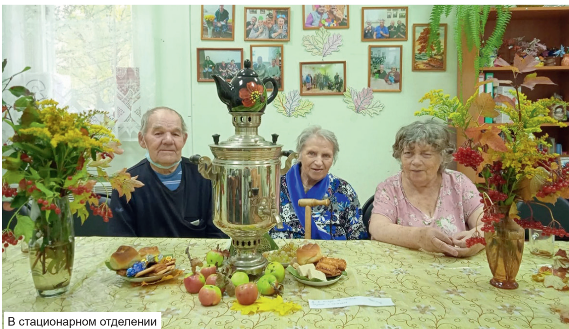
В стационарном отделении

– В этом стационарном отделении с временным проживанием у граждан есть возможность находиться до полугода. Больше