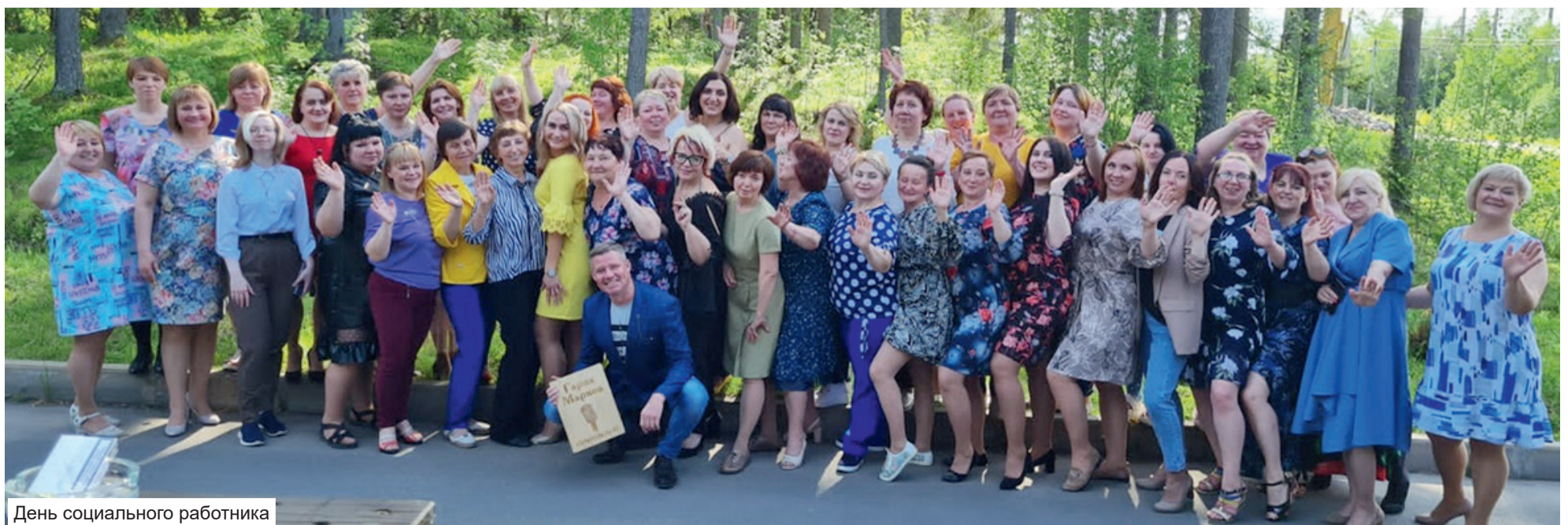
День социального работника

Вадим АЛЕКСАНДРОВ