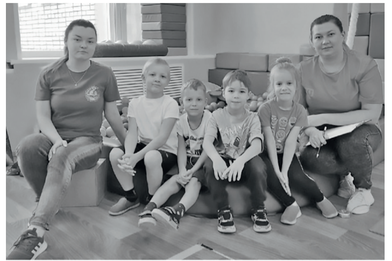
Сотрудники Центра надеются, что сдача норм ГТО станет доброй

Дошкольники отлично справились со всеми заданиями и показали хорошие результаты. В этом им помогло старание и спортивный настрой.