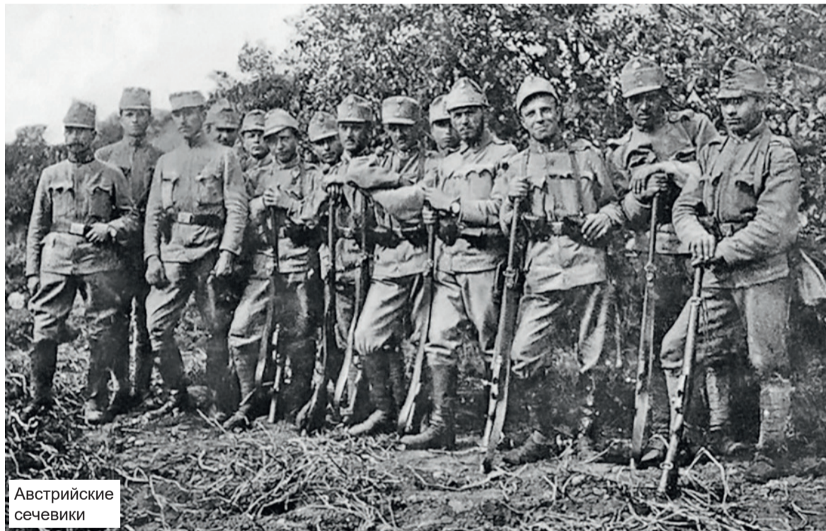
Стилистика текста сохранена

у одного бойца из ножен нож, бросился на Васю сзади. Вася, будто спиной почуяв опасность, резко развернулся и попытался сбить офицера кулаком, но тот увернулся от удара и полоснул его по животу ножом. Попал в бок. Охнув, Вася зажал разрезанную бочину руками, чтобы из неё не вывалились кишки.