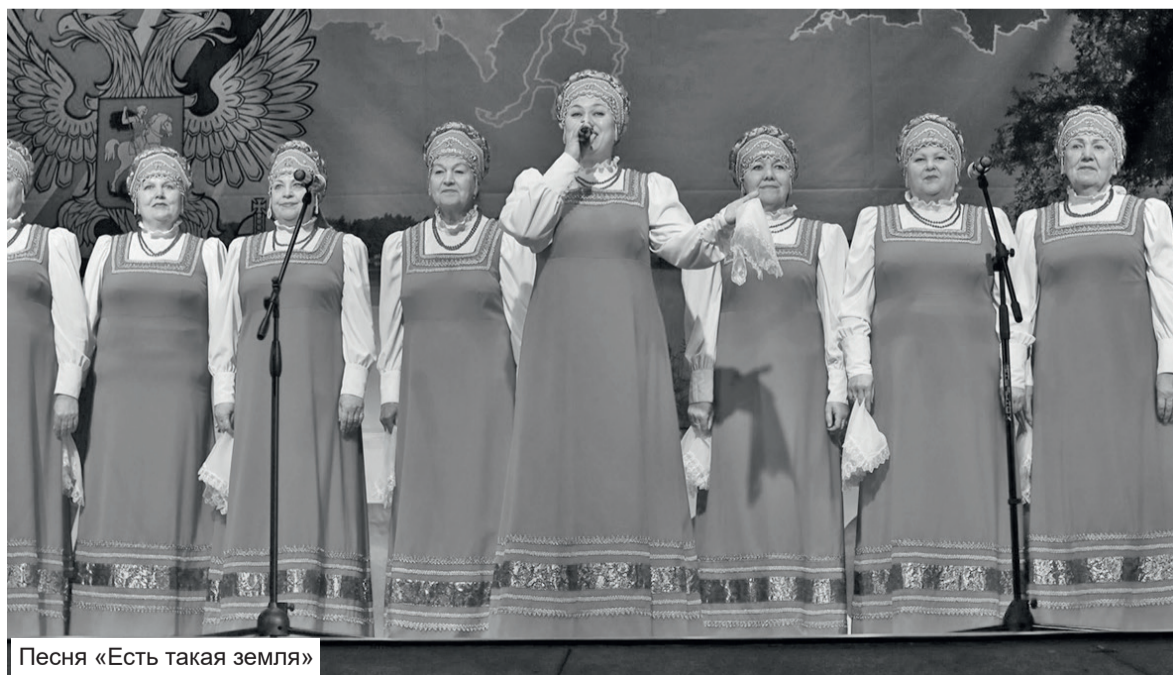
Песня «Есть такая земля»