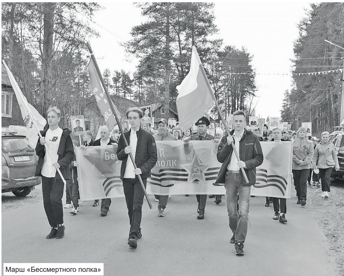
Марш «Бессмертного полка»

21 сентября президент России Владимир Путин выступил с обращением к россиянам, заявив, что судьба России – останавливать тех, кто стремится к мировому господству, и объявил о частичной мобилизации россиян. Естественно, что и Подпорожский район не остался в стороне.