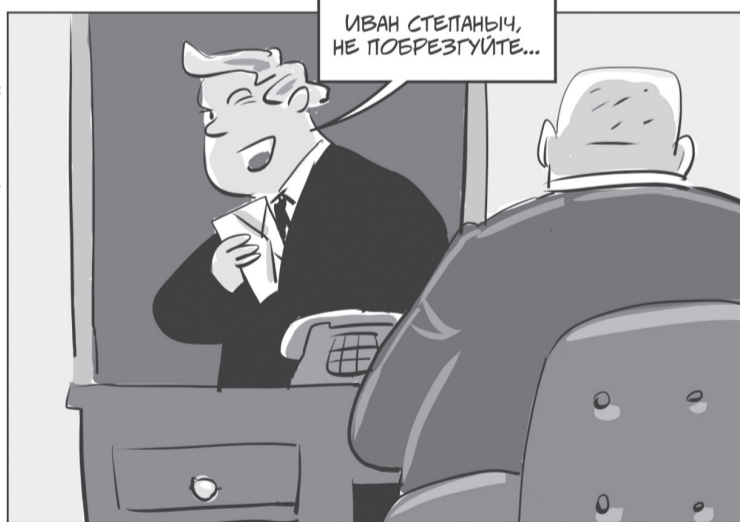
РИСУНОК: АЛЕКСЕЙ ИОРИШ БУЖИЕТ «КОРРУПЦИЯ ВНЕРА – СЕГОДНЯ – ЗАВТРА»

работа правоохранителей, и новые технологии, доступные борцам с коррупцией. Однако главной причиной эксперт назвал объединение страны на фоне внешнеполитических рисков и проведения специальной военной операции.